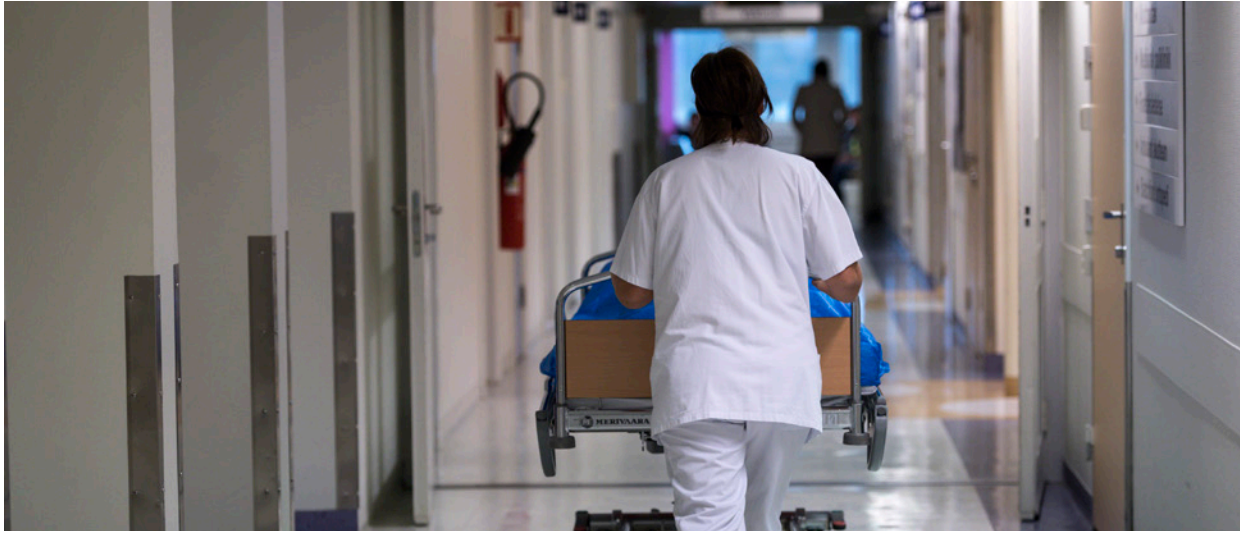
Sykehus er ikke butikk: Rødt vil skrote innsatsstyrt finansiering.