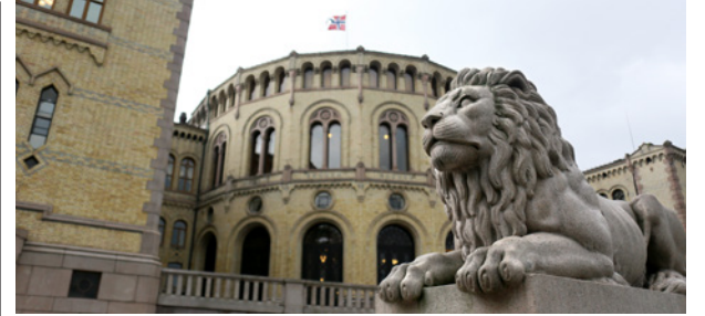
Stortinget: Flertallet vil ikke støtte Rødt-forslag om straffefølgelse av statsledere som starter angrepskrig.