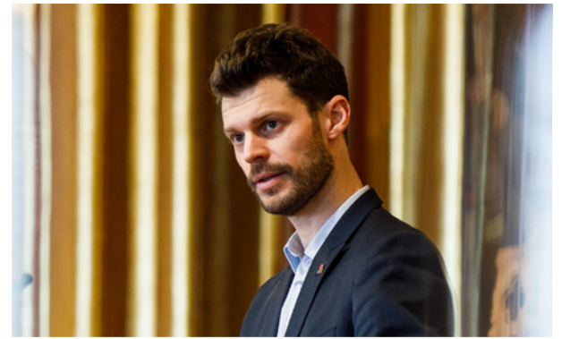
Rødt-leder: Bjørnar Moxnes.